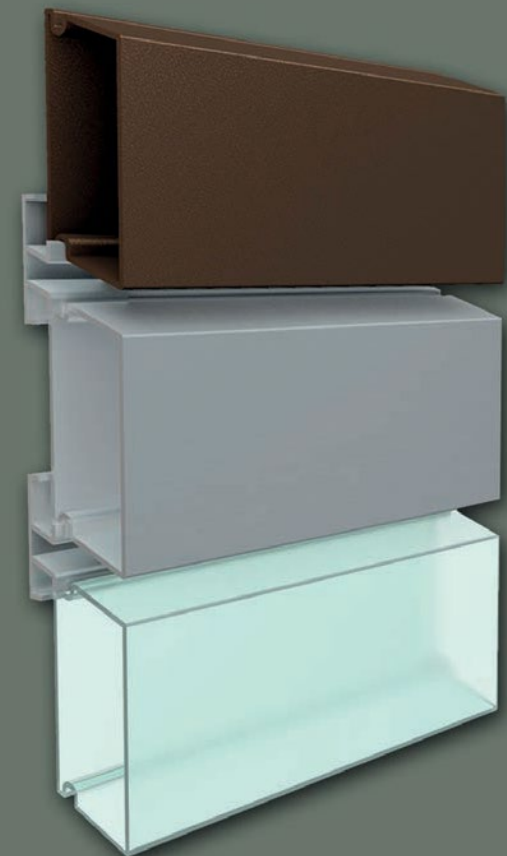
Esempi di colori della Premium-Line

La Rhombus Premium-Line è realizzata in policarbonato vergine e può essere prodotta in quasi tutti i colori desiderati, disponibili sia in versione opaca che traslucida. Questa serie offre la massima flessibilità di progettazione e soddisfa i più elevati standard estetici per i moderni progetti edilizi.